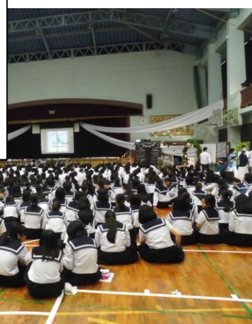
先輩方の話に聞き入る在校生