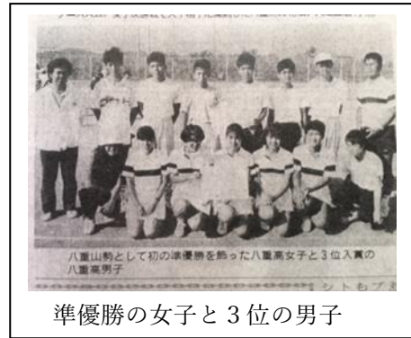
準優勝の女子と3位の男子

今年の新人大会で、後輩の八重高生はどんな活躍を見せてくれるのか、校長として八重高生の活躍を大いに期待している！！