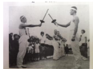
創立記念誌にある写真 聖火リレーは誰？