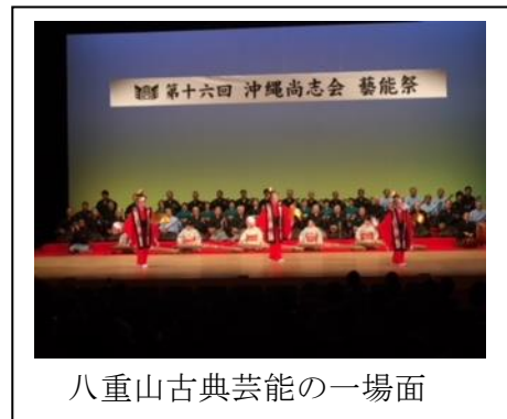
八重山古典芸能の一場面

尚志会は、他にも関西尚志会と東京尚志会の支部があるが、同窓会の結成とその名称の曰くについては、八重山高校創立45周年記念誌に次のように載っている。