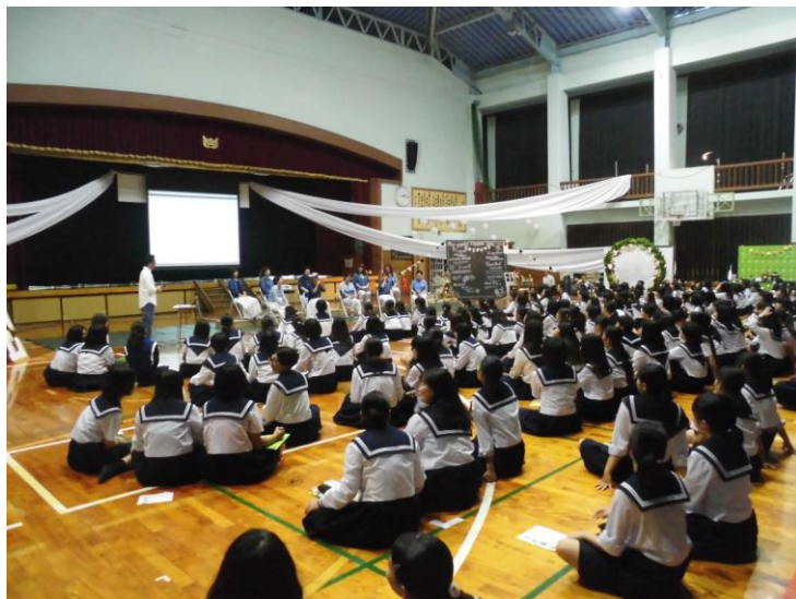
服装を揃えたパネラーの皆さん、とてもカッコイイ！

今年は第25回教育フォーラムで、第1回教育フォーラム時に当時高校3年生であった45期生が担当した。下の写真にもあるように、パネラーの服装も統一し、在校生に楽しんでもらえるような参加型の教育フォーラムであった。この教育フォーラムをきっかけに、八重山高校同窓会（尚志会）が尚一層団結し発展していくことを期待したい。